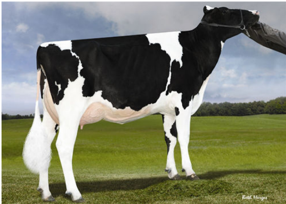
LADYS-MANOR S DAHLIA FIFTH DAM